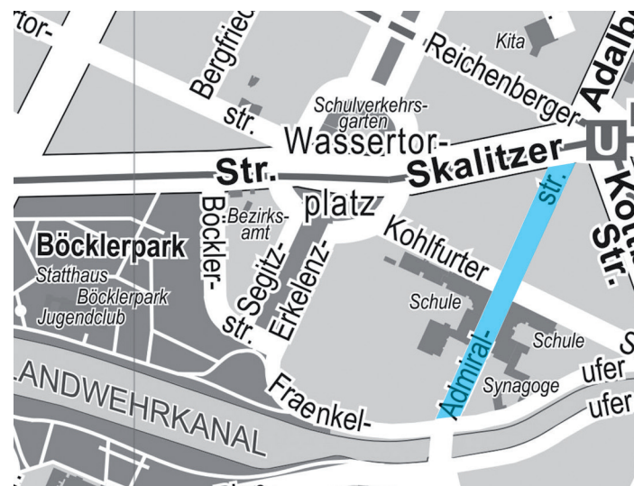
Admiralstraße, in ganzer Länge