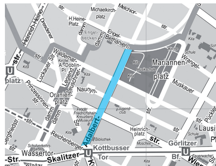
Adalbertstraße, südlicher Abschnitt

Bei einer Umbenennung entstehen für die Anwohner*innen keine Gebühren beim Bürgeramt zur Adressänderung. Zur Änderung der Ausweispapiere wäre lediglich ein Besuch im Bürgeramt erforderlich.