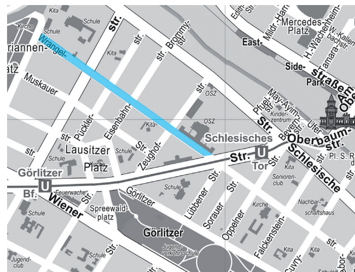
Wrangelstraße, nördlicher Abschnitt

Bei einer Umbenennung entstehen für die Anwohner*innen keine Gebühren beim Bürgeramt zur Adressänderung. Zur Änderung der Ausweispapiere wäre lediglich ein Besuch im Bürgeramt erforderlich.